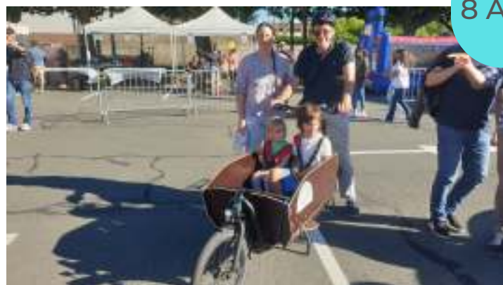
BOURGOGNE ELECTRIC DAY A MONTCHANIN