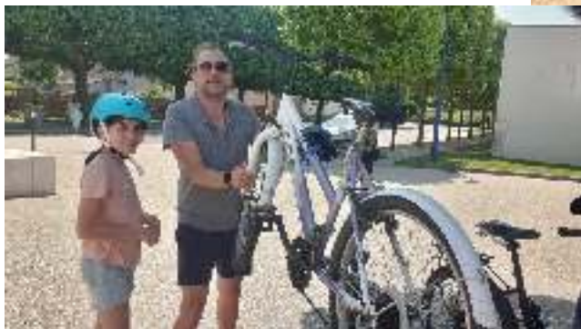
Rue aux enfants - Ecuisses