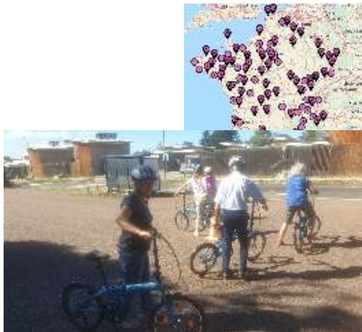
VELO-ECOLE AU LOCAL HARFLEUR

Nos séances de vélo-écoles sont ouvertes à toutes et tous quelque soit le niveau de maîtrise du vélo L'activité vélo-école a également une forte vocation sociale (animation de quartier, santé, insertion sociale et professionnelle). Ce sont à 90% des femmes qui fréquentent la vélo-école.