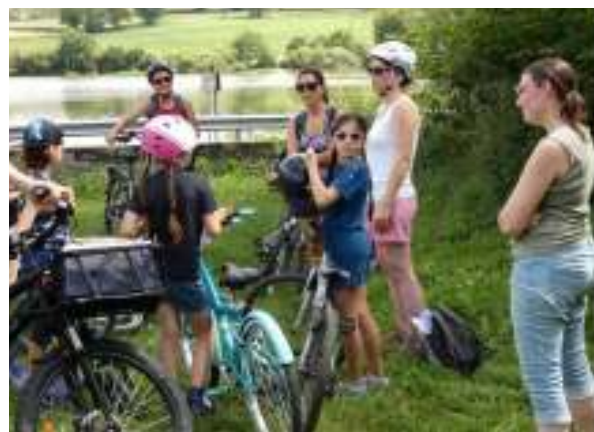
LE CAUE, EN PARTENARIAT AVEC L'ECOMUSÉE DU CREUSOT ET L'ASSOCIATION MINES DE RAYONS AU BORD DU LAC DE SAINT EUSEBE

Faire découvrir le patrimoine culturel, les lieux alternatifs, l'histoire d'une ville, une industrie du territoire... notre territoire d'action étant sur toute la communauté urbaine nous pouvons partir de Montceau-les-Mines et du Creusot pour se rejoindre à la Villa Perrusson par exemple.