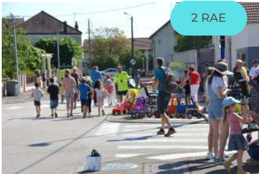
RUE AUX ENFANTS A ECUISSES

Mines de rayons est structure de soutien aux porteurs de projets.