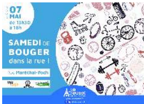
Atelier pendant Samedi de Bouger Rue Foch au Creusot