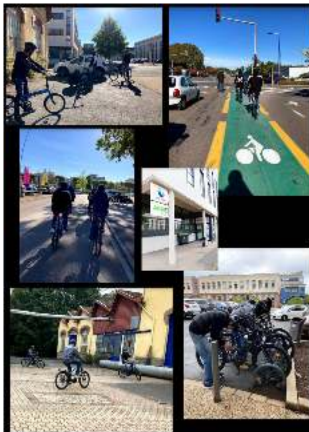
ADULTES D'AGIRE EN FORMATION