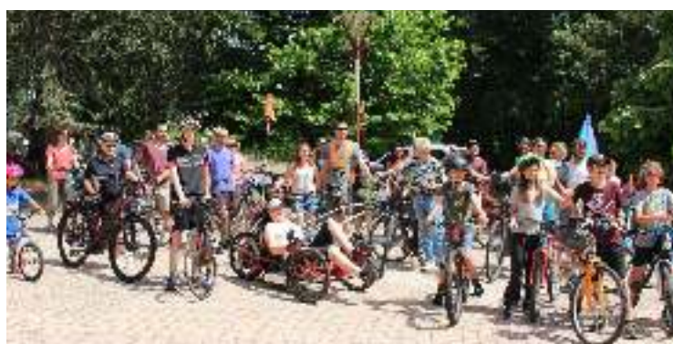
VELORUTION AU CREUSOT

Pour promouvoir le vélo comme moyen de déplacement ; pour des villes conviviales ; contre les pollutions chimiques et mentales des moteurs et de la civilisation industrielle qui va avec. Non à l'auto-moto qui envahit nos rues, nos cerveaux et nos bronches. Oui à l'autonomie ici et maintenant. Véloration !