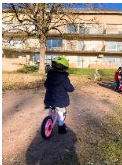
CRECHE LE PTIT EPAD AU CREUSOT