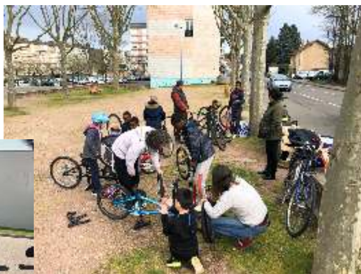
QPV Plessis - Montceau-les-Mines