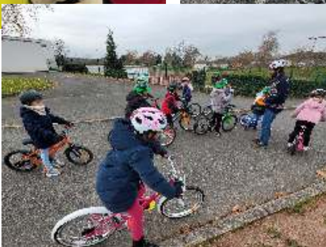
ECOLE CHAMPS CORDET TORCY