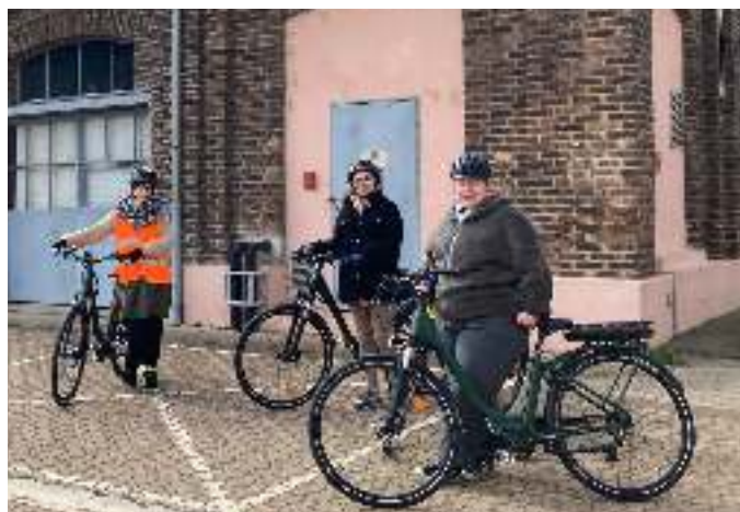
ADULTES DE SOLIDARITE SERVICES EN FORMATION

En 2022, les structures de ré-insertion AGIRE et Solidarité Services ont proposé à leur public et salariés une formation de 15h à la mobilité à vélo afin de permettre aux personnes de se déplacer au quotidien à vélo et de lever les freins à la mobilité pour leur formations et recherche d'emploi.