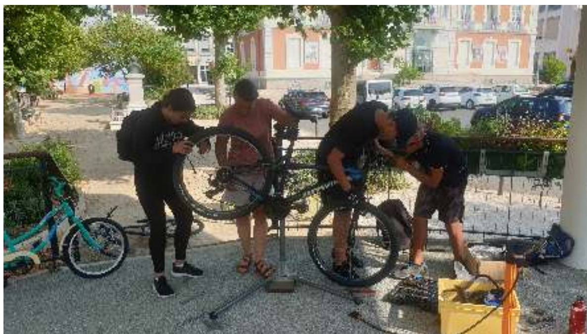
Atelier hors les murs derrière la mairie de Montceau-les-Mines