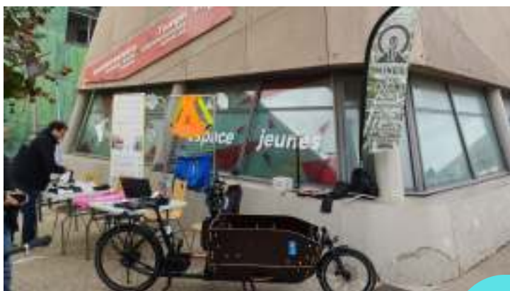
OBJECTIF TERRITOIRE DURABLE A L'ALTO AU CREUSOT